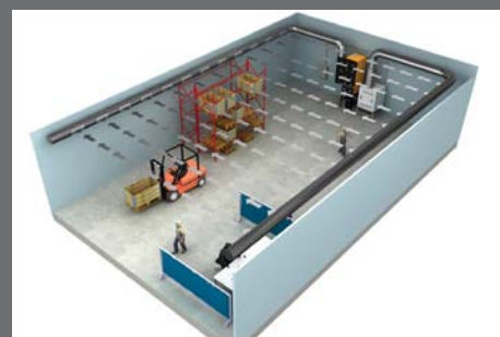
U-vormig push-pull systeem met 1 filterunit en 1 ventilator

Patrick Vlamincx - 0472 999 730 info@geronlas.be - www.geronlas.be